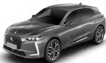
Sivá Platinium (M)