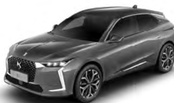
Sivá Platinium (M)