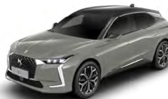
Sivá Laqué (M)