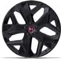
Zliatinové disky 19" MINNEAPOLIS (ZHT1) v sérii pre PERFORMANCE LINE