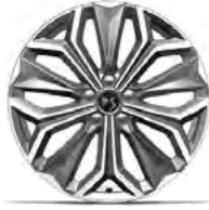
Zliatinové disky 19" FIRENZE (ZHT3) v sérii pre BASTILLE