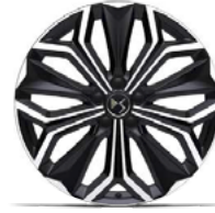
Zliatinové disky 19" SEVILLA (ZHT4) v sérii pre RIVOLI / OPERA