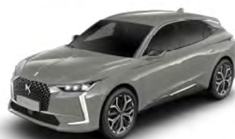
Sivá Laqué (M)