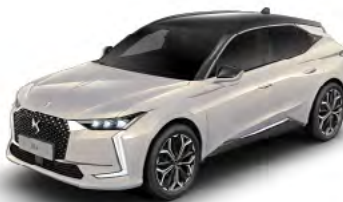
Sivá Cristal Pearl (M)