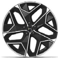
Zliatinové disky 19" LIMA (ZHT2) v sérii pre VOYAGE