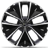
Zliatinové disky 20" SYDNEY (ZHT8) voliteľná výbava pre E-TENSE 225