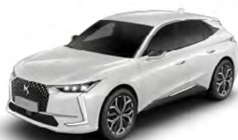
Bielá Perleť (P)