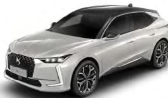
Bielá Perleť (P)